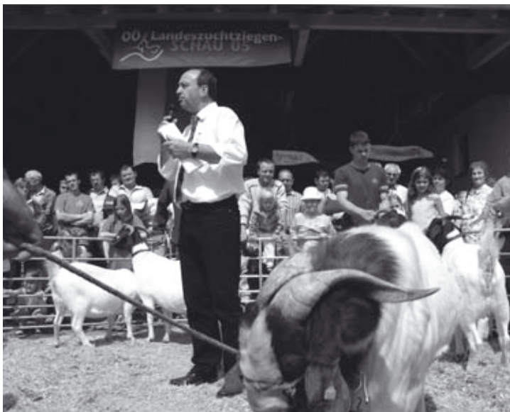
Der Tierzuchtdirektor bewies fachliche Kompetenz bei der Bewertung.

Ziel der Veranstaltung muß sein, Werbung für die Ziegenwirtschaft und deren Produkte zu machen und die Öffentlichkeit auf diese Produktionsnische aufmerksam zu machen. Die verantwortlichen Politiker werden über die Absicht der Ziegenwirtschaft informiert. Wir ersuchen alle Leser dieser Zeitung uns Tipps und Anregungen zukommen zu lassen, wie wir eine landesweite Veranstaltung noch attraktiver gestalten können.