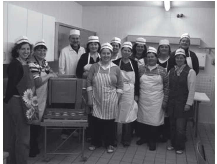
Praktikerinnen mit Kursleiter