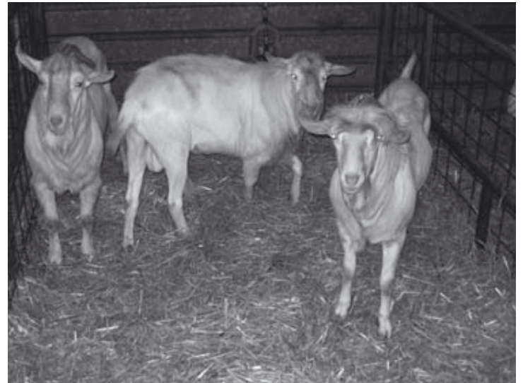
Züchterisch hochwertige Tiere werden bei den Versteigerungen aufgetrieben

auf die Versteigerung vorbereitet werden. Wenn die Böcke von Müttern stammen, die noch nicht bewertet sind, müssen sie das dem Verband melden, damit die Bockmutter-Bewertung erfolgen kann. Der Verband wird für die Versteigerung entsprechend Werbung machen – wir verlassen uns, dass die Züchter ihren vorgesehenen Beitrag (Anbieten von züchterisch hochwertigen Böcken) dazu leisten.