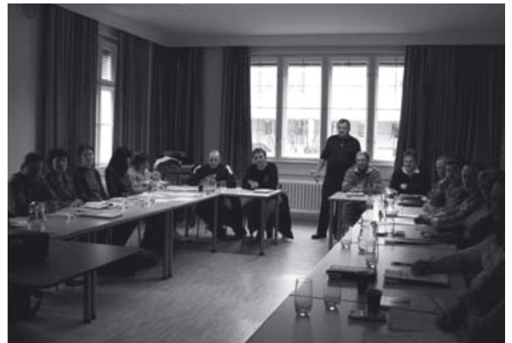
Die Ziegenhalter wappnen sich für neue Aufgaben.