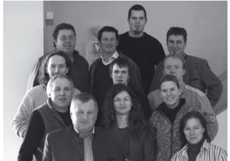
Der gesamte neue Vorstand bei der Generalversammlung 2007

Die Vorstandsmitglieder bedanken sich für das entgegengebrachte Vertrauen und ersuchen um intensive Zusammenarbeit. Wenn alle das gleiche Ziel verfolgen und an der Weiterentwicklung arbeiten, dann geht diese Sparte einer gesicherten Zukunft entgegen.